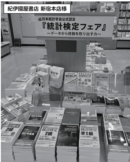
紀伊國屋書店 新宿本店様

※CBT試験の導入で都合の良い日時・会場で受験可能 (全国312会場)。詳しくは統計検定HPにてご確認ください。